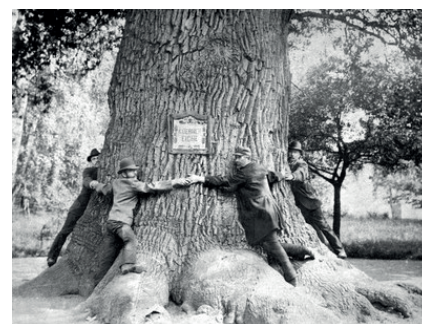
(Objímání Körnerova dubu na pohlednici, kolem r. 1895.)