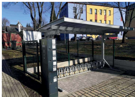
Stojan na kola s nabíjecí stanicí pro elektrokola za obecní knihovnou (před vstupem do areálu ZŠ) mohou v případě zájmu využívat i žáci ZŠ. Prostor je monitorován.