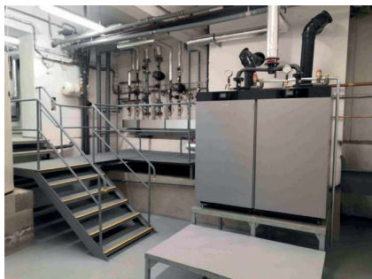
Kompletně zrekonstruovaná kotelna v budově 2. stupně ZŠ