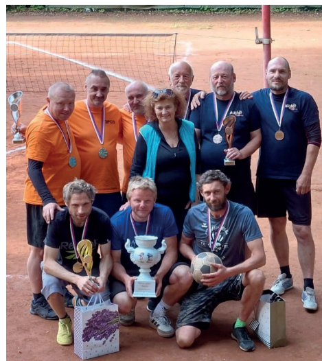
Zlato vybojovali Žampioni, 2. místo Tři fotři a 3. místo Alkáči