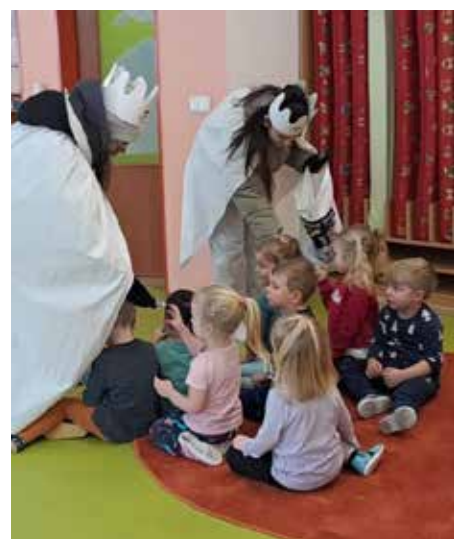
Návštěva tří králů potěšila i děti v mateřské školce.