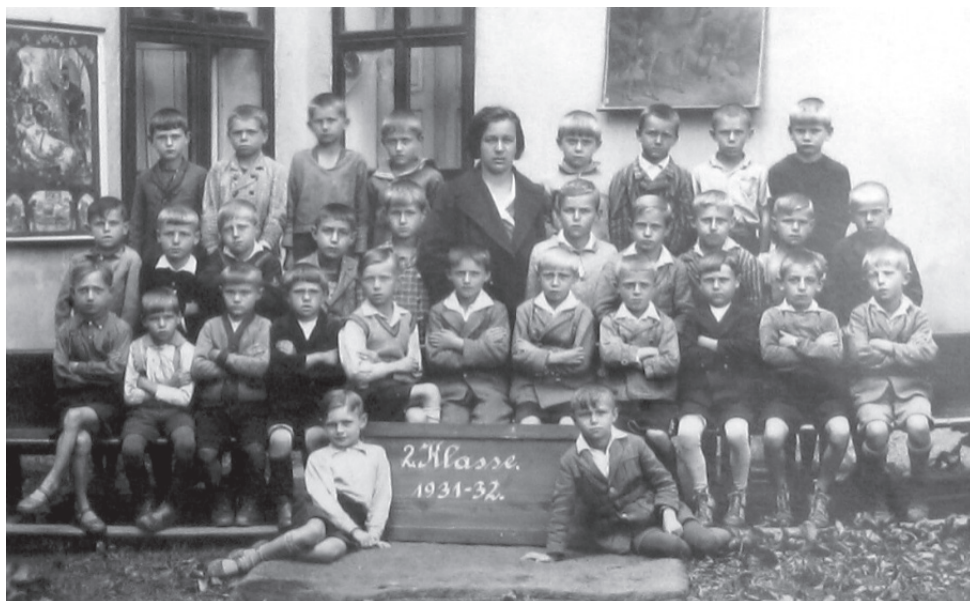
Školní fotografie chlapců 2. třídy z obecné školy chlapecké ve školním roce 1931-1932