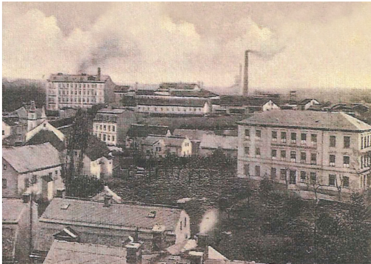
Pohled na střední část Dalovic, vpravo budova školy (dnes 1. stupeň), vlevo za stromem tehdy ještě patrový dům čp. 26, kde škola sídlila do r. 1885.

Kolem r. 1841 se porcelánka v Dalovicích začala více rozvíjet a do obce přibývalo stále více rodin s dětmi. Putovní škola měla už tolik dětí, že nebylo možné se s nimi stěhovat z místa na místo. Vedení porcelánky zajistilo z tohoto důvodu pro školu dům s čp. 26 (dnes nízká budova vlevo před vchodem do areálu ZŠ – pozn. red.), který původně patřil k panství. Škola na tomto místě zůstala až do r. 1885.